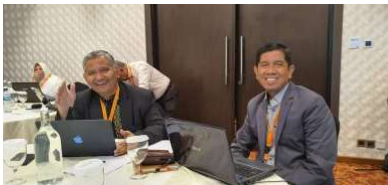
Gambar 2. Dua Nara Sumber

mencakup beberapa komponen, yaitu keberhasilan target jumlah peserta pelatihan, ketercapaian target materi yang telah direncanakan, ketercapaian tujuan pelatihan dan kemampuan peserta dalam penguasaan materi. Ketercapaian target jumlah peserta dapat dilihat dari jumlah peserta yang ditargetkan adalah 60 orang dan pada kenyataannya kegiatan diikuti sebanyak 68 orang sehingga target jumlah peserta telah dapat terpenuhi. Semua peserta dapat mengikuti seluruh proses simulasi dari awal sampai selesai, kegiatan yang dirancang 100% terlaksana, dan kehadiran kesiapan tim dosen 100%. Target penyampaian materi simulasi juga tercapai karena materi dapat disampaikan secara keseluruhan. Dengan demikian maka tujuan kegiatan Pengabdian Kepada Masyarakat dapat terpenuhi.