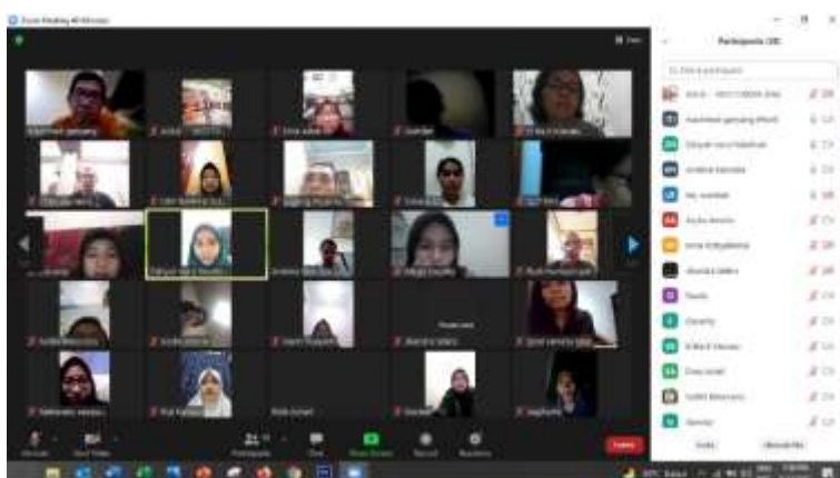
Gambar 1. Pelaksanaan Kegiatan